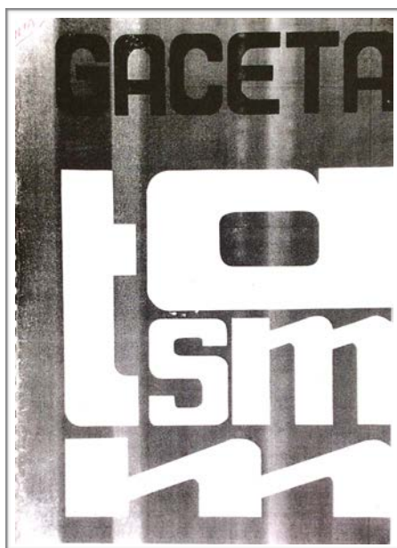
Gaceta de los Trabajadores Argentinos de la Salud Mental en México. México, 1981. Número 1.

La gaceta fue el resultado de más de seis años de residencia y trabajo en México. Como se había señalado páginas arriba, los psicoanalistas se habían insertado en las distintas organizaciones y se integraron a las comisiones de salud mental, dando atención terapéutica a connacionales y a exiliados latinoamericanos. Lo que se buscaba, a partir de esta publicación, era visibilizarse y transmitir lo que se venía realizando, así como a invitar a sus colegas en el extranjero a participar, interrogando, proponiendo alternativas y propiciar diálogos que contribuyeran a dar cuenta de este número de profesionales y del pueblo exiliado que era alto en número.