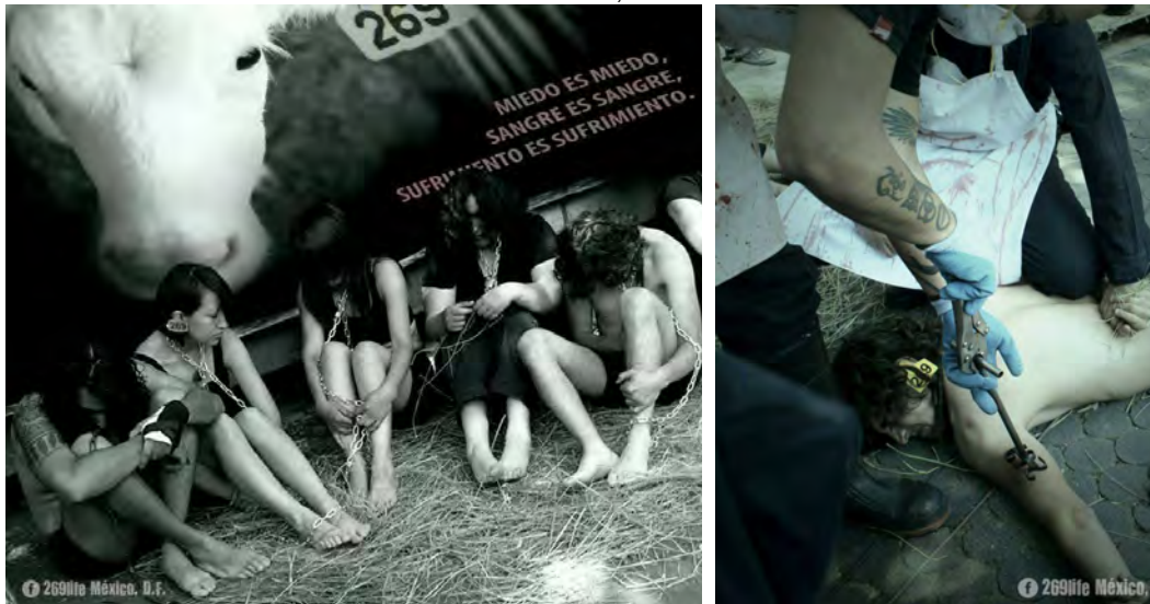
IMAGEN 2.2. Marcaje, 269Life. 2 de octubre 2013, Ciudad de México.