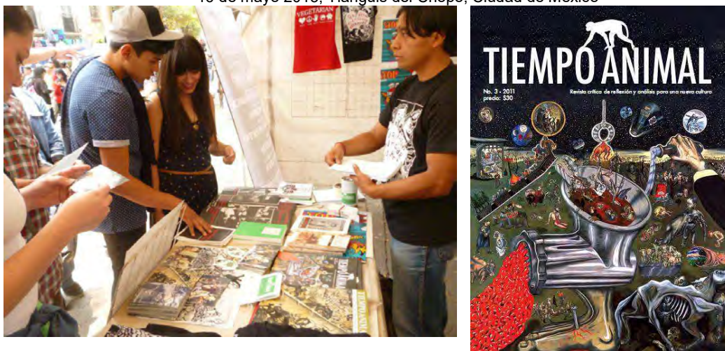
IMAGEN 2.3. Mesa informativa de Tiempo Animal. 16 de mayo 2013, Tianguis del Chopo, Ciudad de México