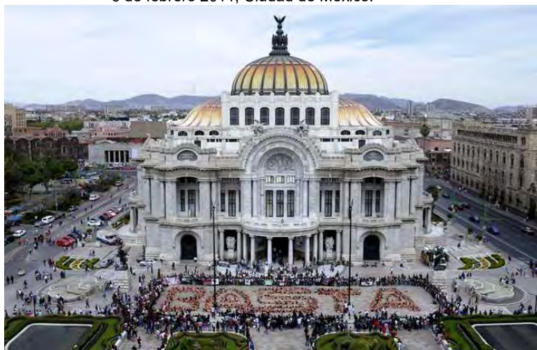
IMAGEN 3.3 En la piel del toro, Palacio de Bellas Artes. 6 de febrero 2011, Ciudad de México.