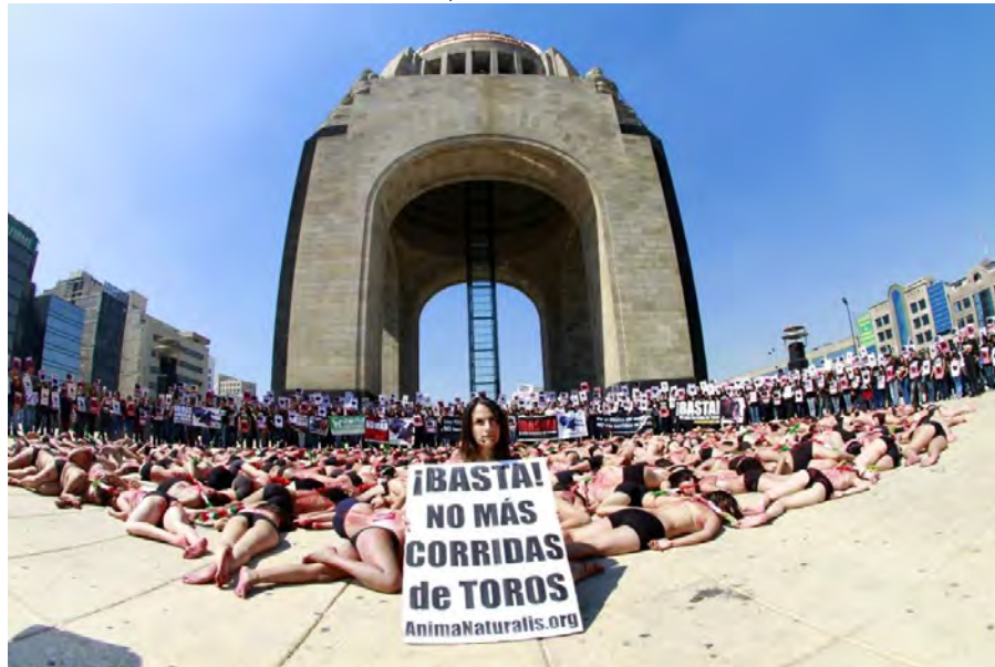
IMAGEN 3.2 En la piel del toro, Monumento a la Revolución. 3 de febrero 2013, Ciudad de México.