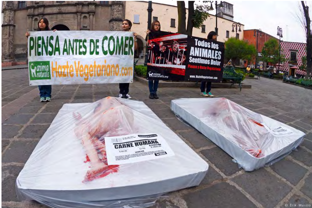
IMAGEN 2.1 Día Mundial sin carne, AnimaNaturalis. Coyoacán, Ciudad de México, 20 de marzo 2015.