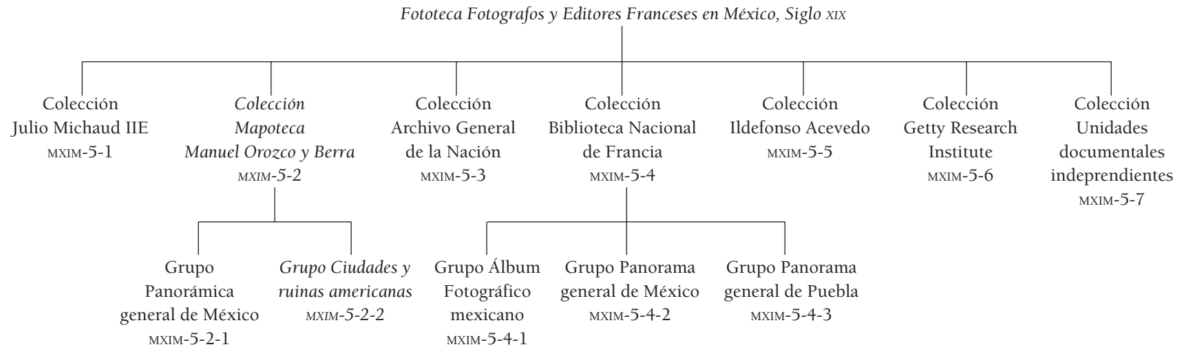
Diagrama 1. Cuadro de clasificación archivística