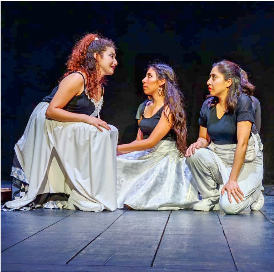
Función de Espejismos/Corte A en Teatro Casa de la Paz, Universidad Autónoma Metropolitana, domingo 19 de mayo de 2024

construir la escena en su conjunto. Uno de ellos es que el personaje de la chica que es interpelada por sus compañeras se encuentra en el parque tocando la guitarra cuando ellas llegan y aunque trata de escabullirse, no lo logra. La chica deja la guitarra a un lado y entonces viene el diálogo planteado anteriormente. Esto ayuda a generar la ilusión de un espacio-tiempo que es distinto, mucho más realista y casual en comparación con las escenas iniciales de Espejismos/Corte A . Esto se puede apreciar mejor en la imagen a continuación.