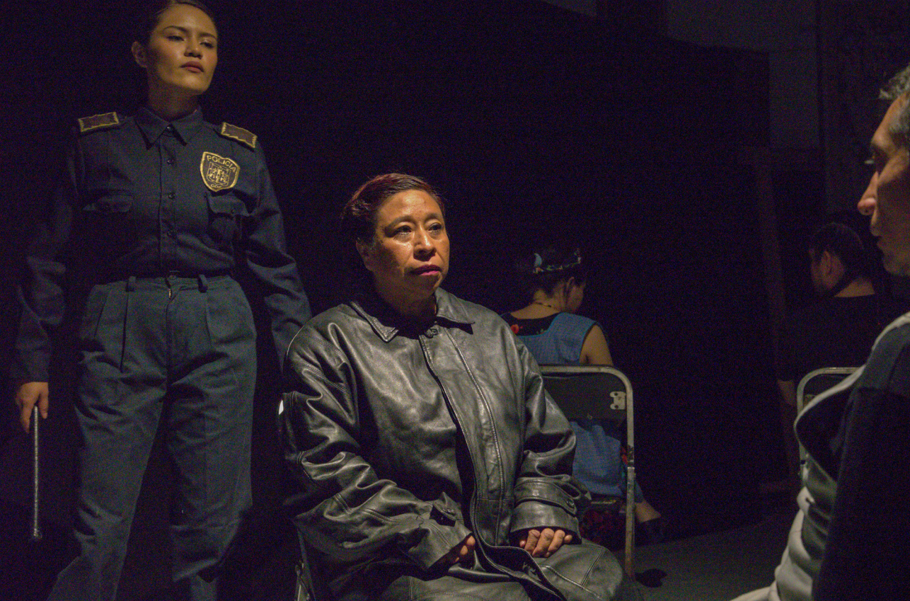
Función de Salitre , Foro Artemis, Ciudad Nezahualcóyotl, 21 de julio de 2024.