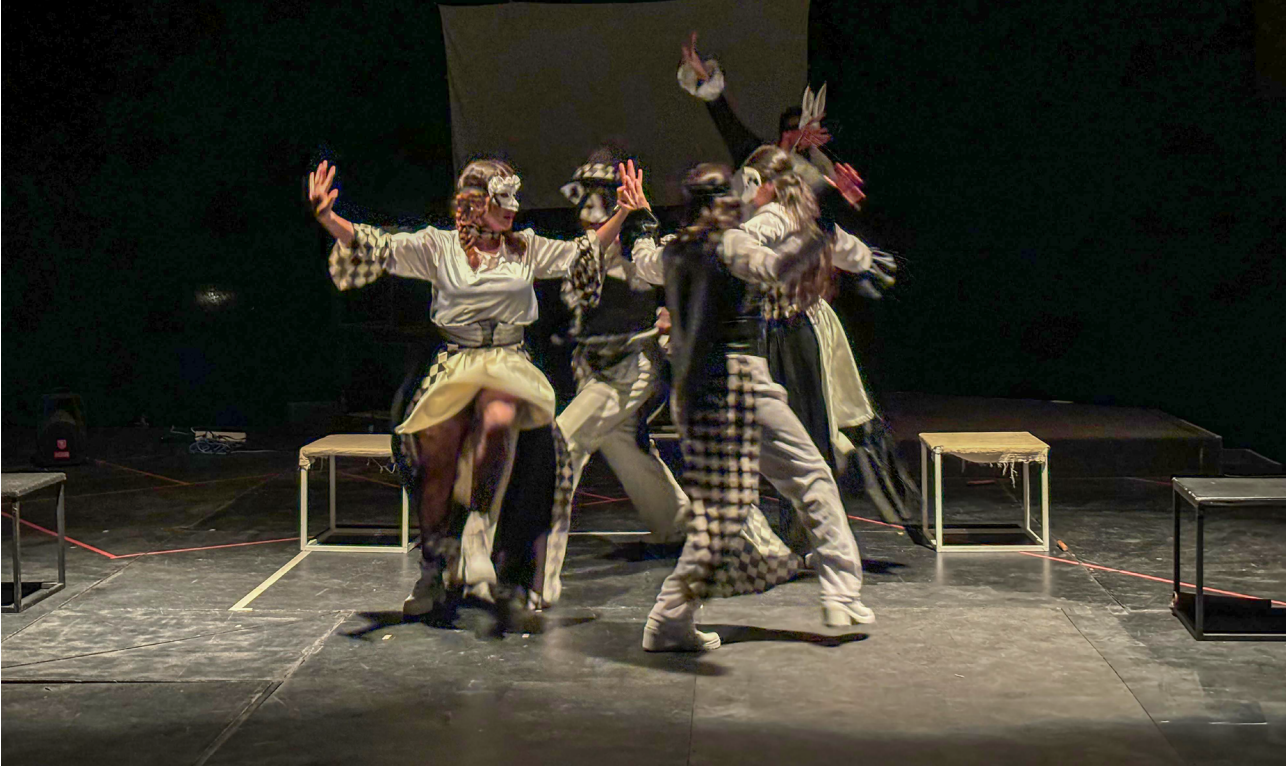
Función inaugural de Espejismos/Corte A en el Centro de Arte Dramático, CADAC, A. C., jueves 21 de marzo de 2024.

Es importante notar que las líneas utilizadas para construir la versión final de los parlamentos individuales y del diálogo en su conjunto pueden provenir de un solo fragmento de entrevista, de varios fragmentos o incluso de varios testimonios, como se muestra en el ejemplo. Hacer este tipo de combinaciones, no sólo ayuda a diluir la identidad específica de quien está hablando sino también genera el efecto de que las voces pertenecen al coro, a una especie de Fuenteovejuna .