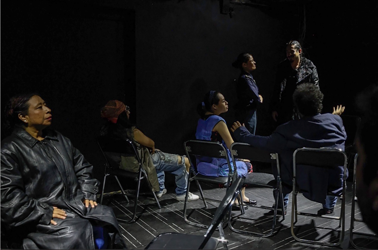
Función de Salitre , Foro Contigo América, 2 de agosto de 2024. Fotograma de video.