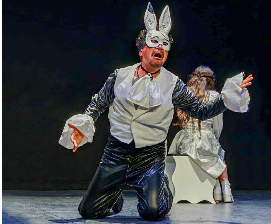
Función de Espejismos/Corte A en el Centro de Arte Dramático, CADAC, A. C., domingo 19 de mayo de 2024.